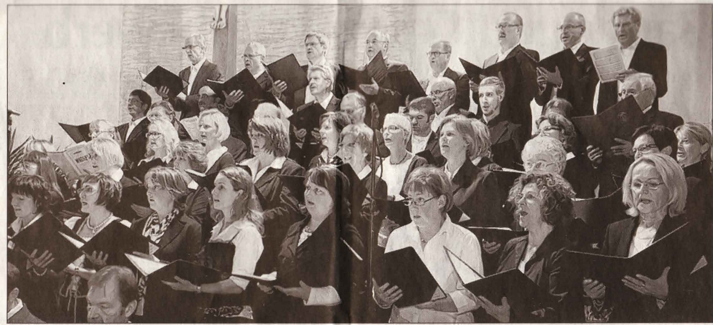
Die große Chorgemeinschaft: Beim Konzert am Sonntag übertraf sie sich selbst. Nur Dank der Spenden der Bevölkerung und der Firmen ist es dem Kulturforum möglich, dieses Festival alle drei Jahre zu organisieren.